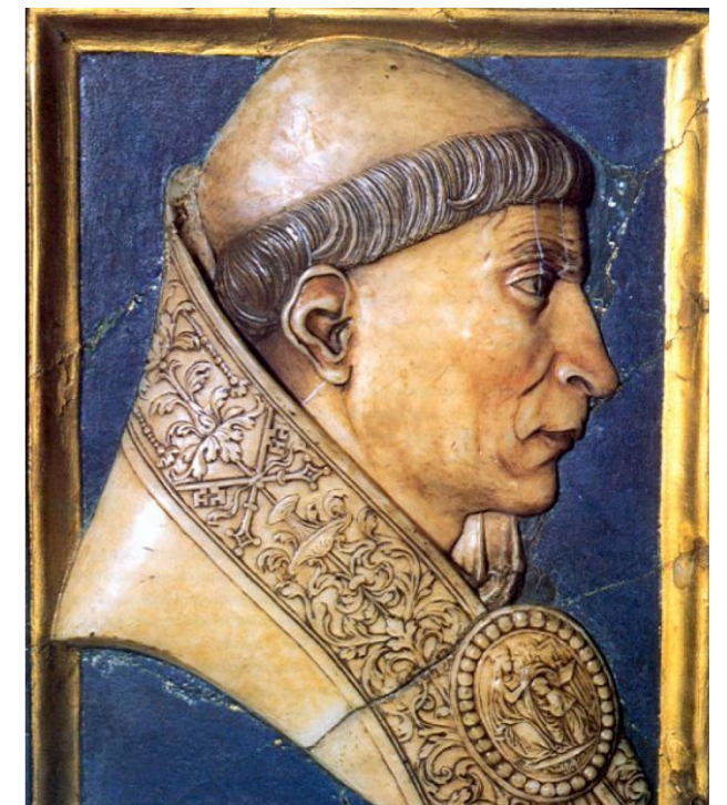
Retrato del Cardenal Cisneros, Felipe Vigarny, s. XVI. Universidad Complutense de Madrid.